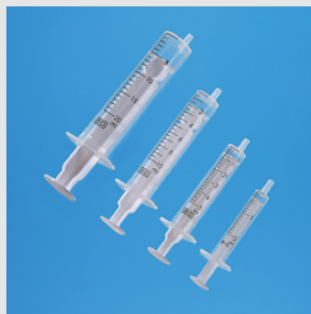
Fiche technique HYP 02 Seringues 2 pièces